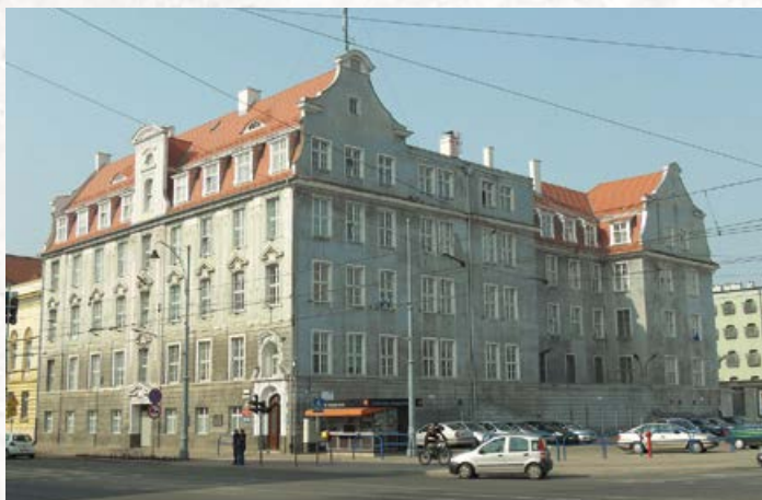
Siedziba Komisariatu Generalnego RP w Wolnym Mieście Gdańsku w latach 1921-39, (Neugarten) ul. Nowe Ogrody 27