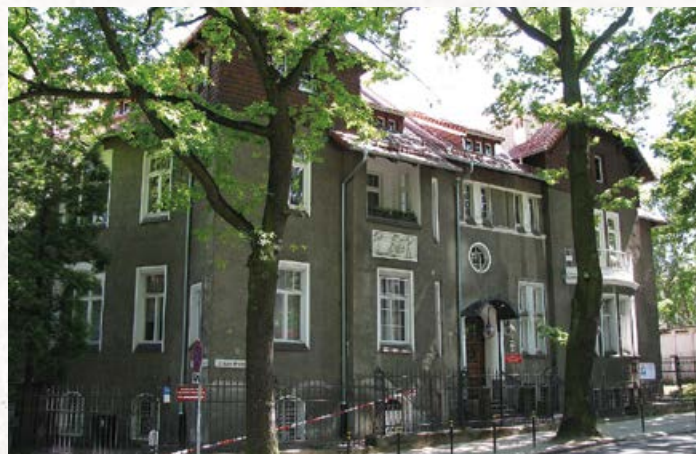
Siedziba Komisariatu w latach 1920–21 (Delbrückkalle); dziś ul. M. Skłodowskiej-Curie 3a