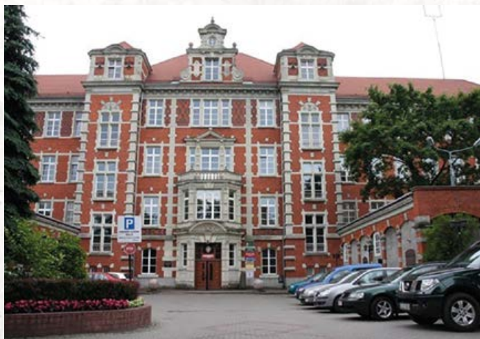
Aktualna siedziba RDLP w Gdańsku