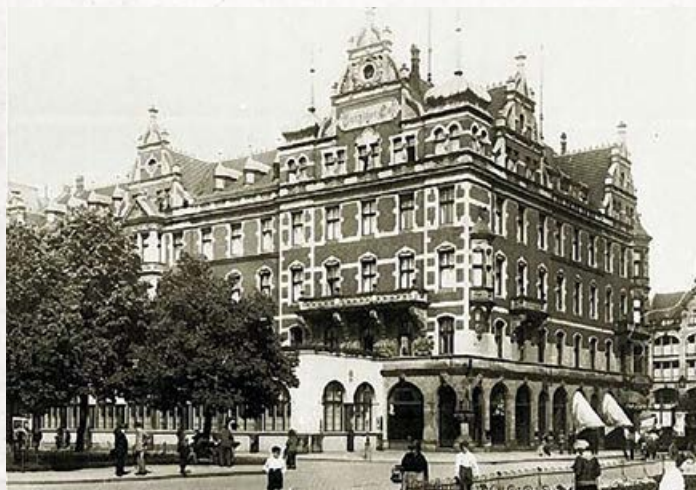
Siedziba Komisariatu w 1920 roku, dziś już nieistniejący hotel Danziger

Po powołaniu Komisariatu (listopad 1919 r.) Komisarz Generalny RP początkowo urzędował w obecnie nieistniejącym hotelu Danziger Hof przy ul. Dominikswall 6 (Wały Dominikańskie, a obecnie Wały Jagiellońskie 2/4), zaś 7 czerwca 1920 r. przeniósł się do budynku przy ul. Delbrückkalle 3a (obecnie ul. M. Skłodowskiej-Curie w Gdańsku-Wrzeszczu, gdzie mieści się siedziba rektoratu Gdańskiego Uniwersytetu Medycznego). W 1921 r. Komisariat przeprowadził się na ul. Neugarten 27 (obecnie Nowe Ogrody) do gmachu zbudowanego na potrzeby Zarządu